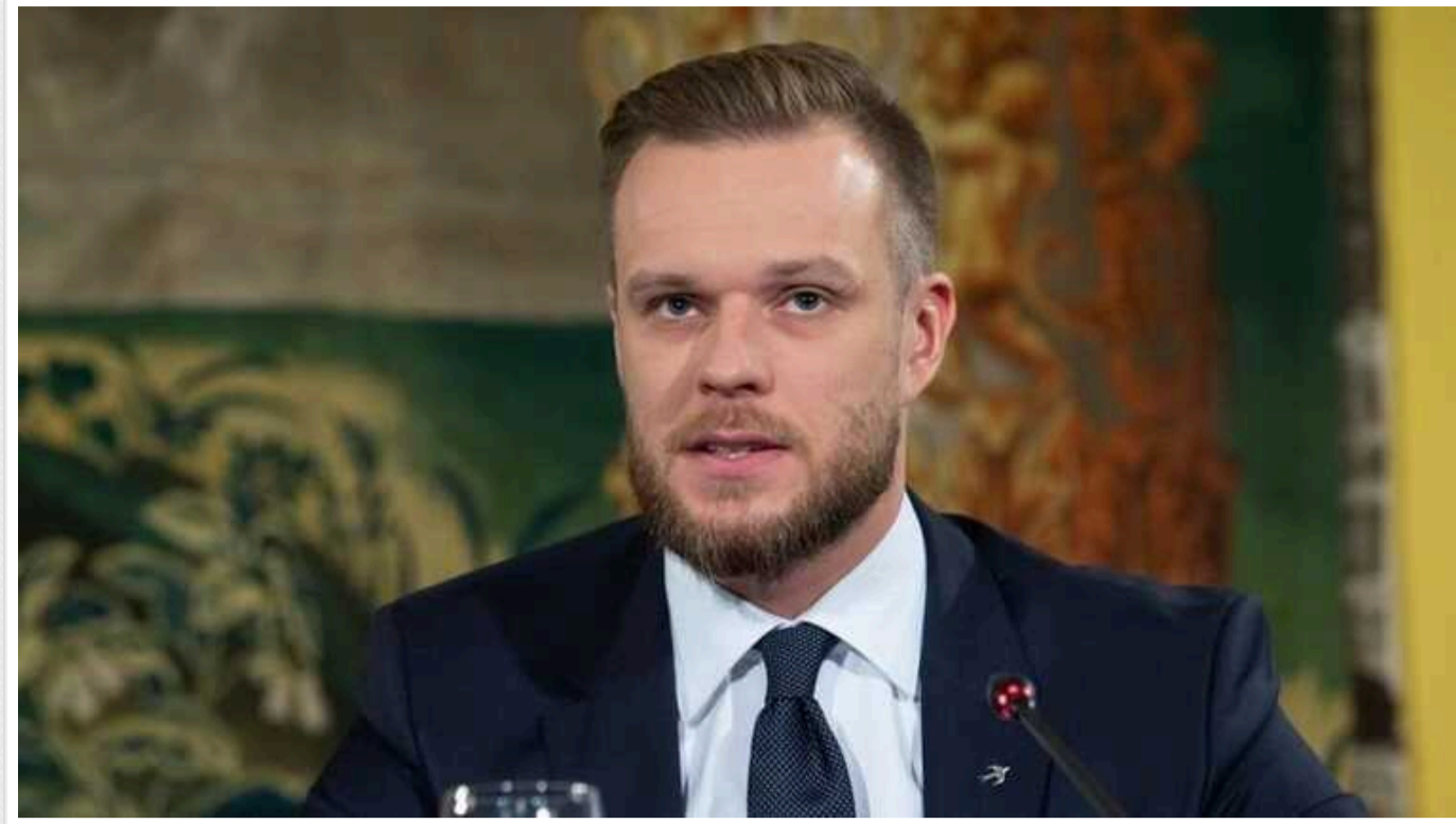
Литва готова повернути в Україну своїх військових інструкторів, які перебували там до початку війни

Про це в ефірі телеканалу LCI заявив міністр закордонних справ Литви Габріелюс Ландсбергіс.