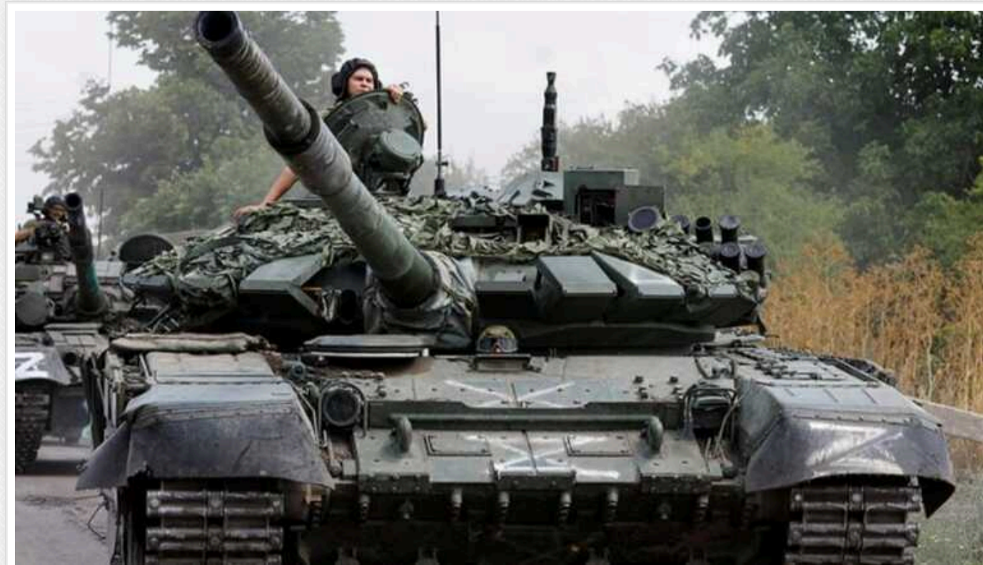
Окупанти в Харківській області можуть розпочати наступ ще за одним напрямком, - військовий