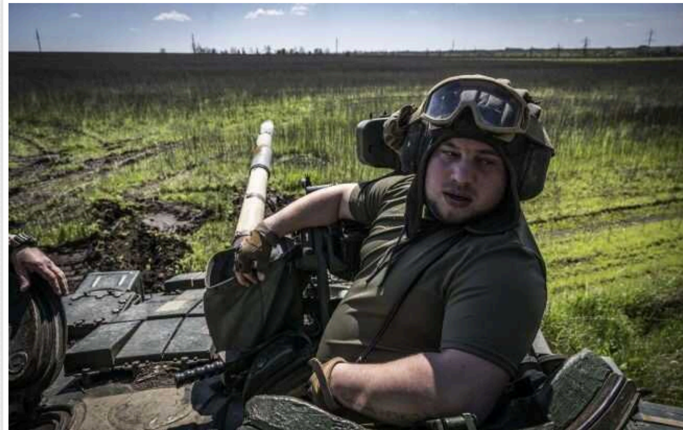
Окупанти розпочали наступ ще на одному напрямку на кордоні у Харківській області, - Deep State

Карта українського ресурсу Deep State показує, що Армія РФ розпочала наступ ще на одному напрямку на кордоні в Харківській області у бік села Зелене.