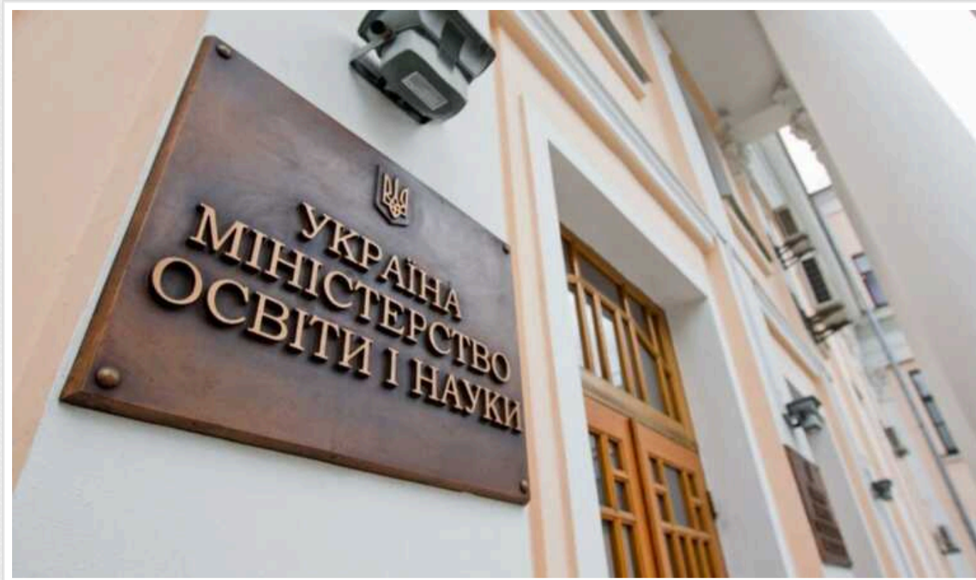
В МОН ускладнили умови вступу до ВНЗ у 2024 році

Міністерство освіти України ускладнює порядок вступу до вищих навчальних закладів цього року.