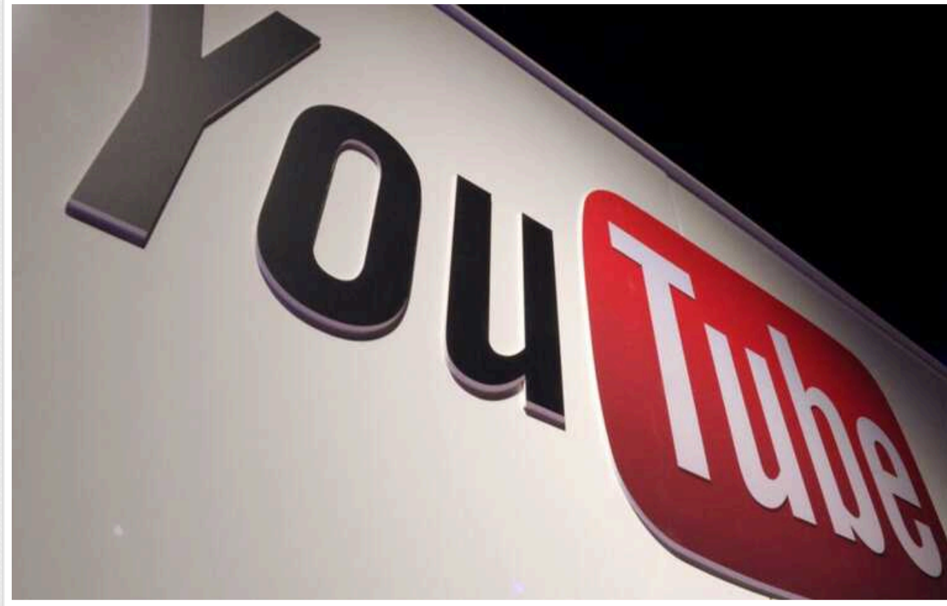
Відеохостинг YouTube блокує антивоєнний контент на вимогу влади РФ

YouTube почав блокувати в Росії опозиційний контент на вимогу російської влади.