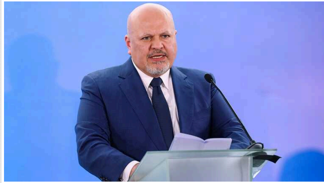
Прокурор Міжнародного кримінального суду вимагає видати ордер на арешт Нетаньягу

Прокурор Міжнародного кримінального суду Карім Хан зажадав видачі ордера на арешт прем'єр-міністра Ізраїлю Беньяміна Нетаньягу, міністра оборони Ізраїлю Йоава Галанта та трьох лідерів ХАМАС.