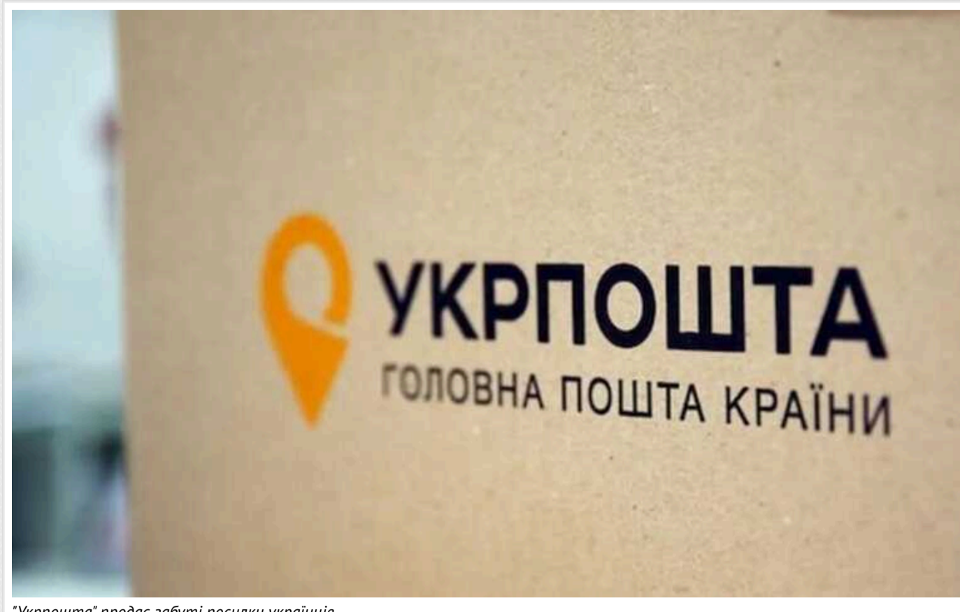
"Укрпошта" продає забуті посилки українців

На першому аукціоні з продажу забутих посилок "Укрпошта" продала 4 палети з ними за 120 тис. грн. При цьому стартова ціна кожного складала 1,2 тис. грн, тобто початкова вартість 4 палет була 4,8 тис. грн.