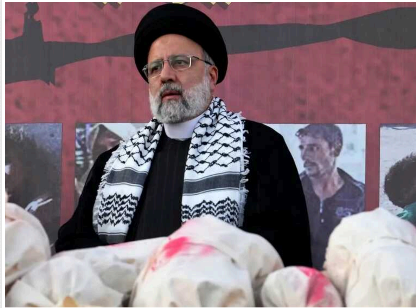
The Economist: Загибель президента Ірану викличе боротьбу за владу

The Economist пише, що смерть президента Ірану викличе боротьбу за владу на високому рівні.