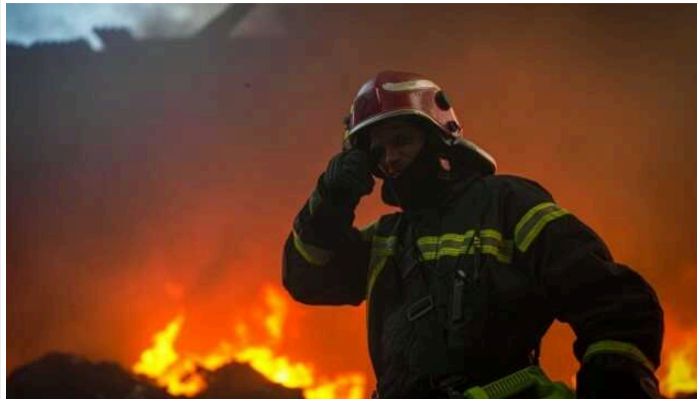
На Львівщині внаслідок збиття "Шахеда" сталося займання у лісництві в Золочівському районі

Унаслідок збиття "Шахеда" над Львівщиною сталося займання у лісництві в Золочівському районі площею 1 гектар, – повідомляють у Львівській ОВА.