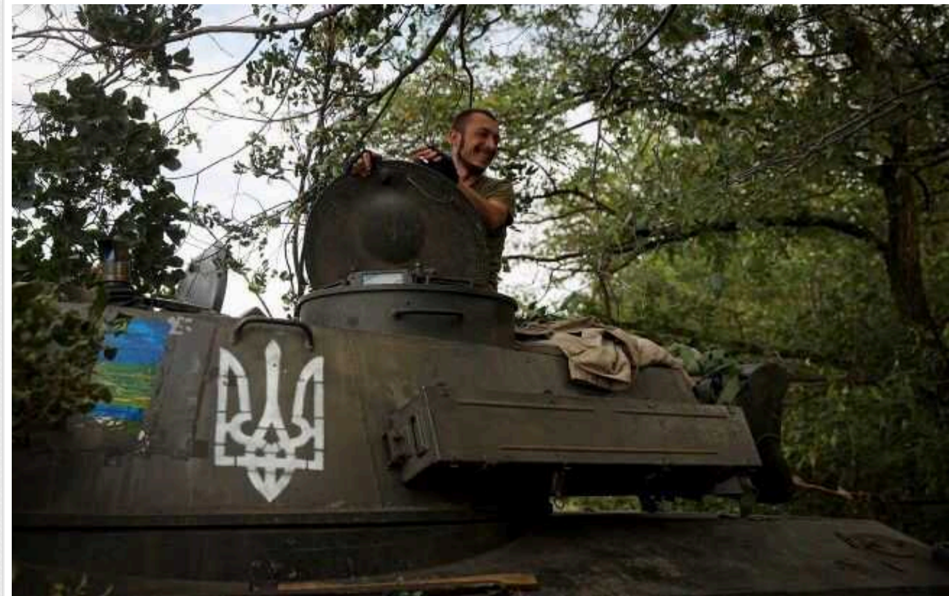
Ситуація на фронті: окупанти пішли в атаку в напрямку села Стариця на Харківщині, ЗСУ посилюють оборонні рубежі

З початку доби 20 травня ситуація на фронті загострена. Сили оборони продовжують зосереджувати основні зусилля на гідній відсічі окупантам.