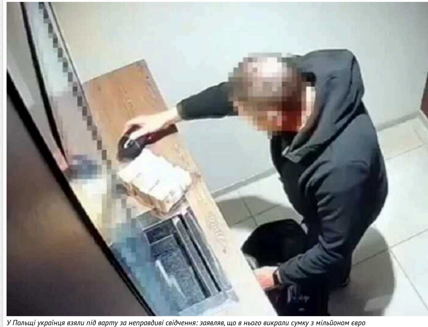
У Польщі українця взяли під варту за неправдиві свідчення: заявляв, що в нього викрали сумку з мільйоном євро

У Польщі заарештували 58-річного громадянина України за надання неправдивих свідчень. У квітні поточного року він заявляв, що в центрі Варшави у нього викрали сумку із 4 мільйонами злотих (близько мільйона євро).