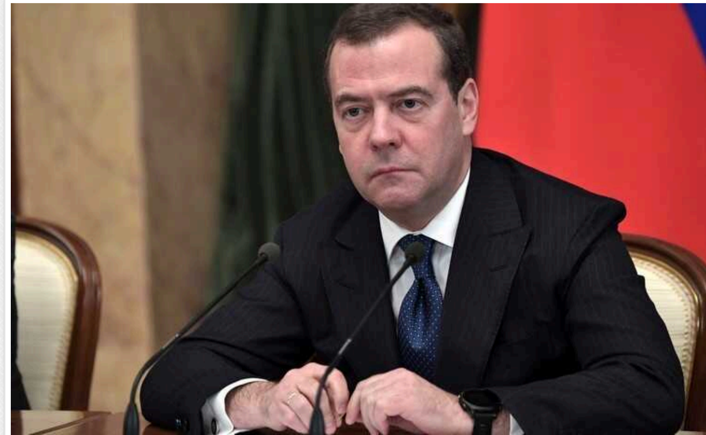
Медведєв погрожує «Яндексу»: його ШІ не захотів відповідати про нібито нацизм в Україні

Заступник голови Ради безпеки РФ Дмитро Медведєв пригрозив російській інтернет-компанії "Яндекс" через те, що її голосовий помічник "Аліса" не зміг надати відповіді, які узгоджуються з поточною російською державною пропагандою.