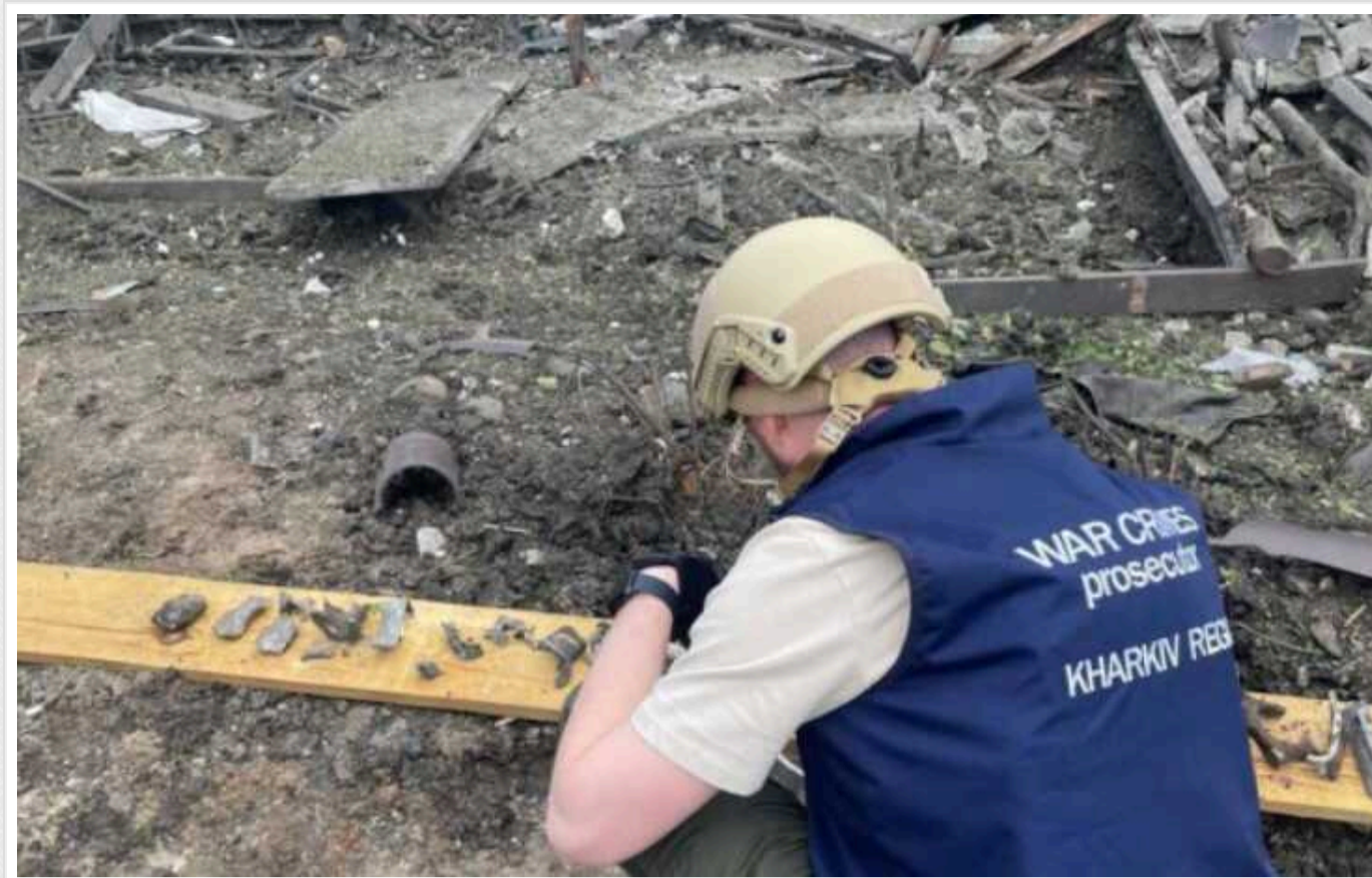
У Харківській області оголосили День жалоби

Завтра, 20 травня, у Харківській області День жалоби у зв'язку із загибеллю 11 людей через російські обстріли.