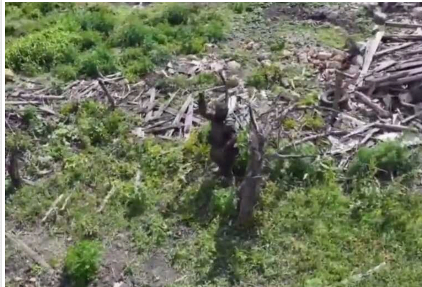
Темношкірий найманець армії РФ відбивається палицею від дрона ЗСУ

Росія залучає найманців із африканських країн до війни в Україні. Так, оператори дронів вистежили такого темношкірого солдата армії Росії.