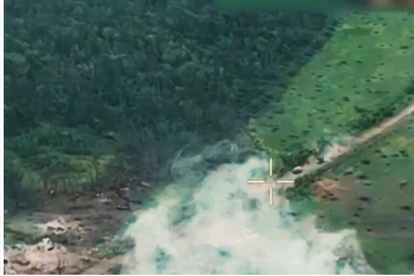
Українські розвідники показали ефективне відео відбиття штурму окупантів

Російські окупанти за підтримки значної кількості техніки намагалися прорватися в Часів Яр Донецької області.