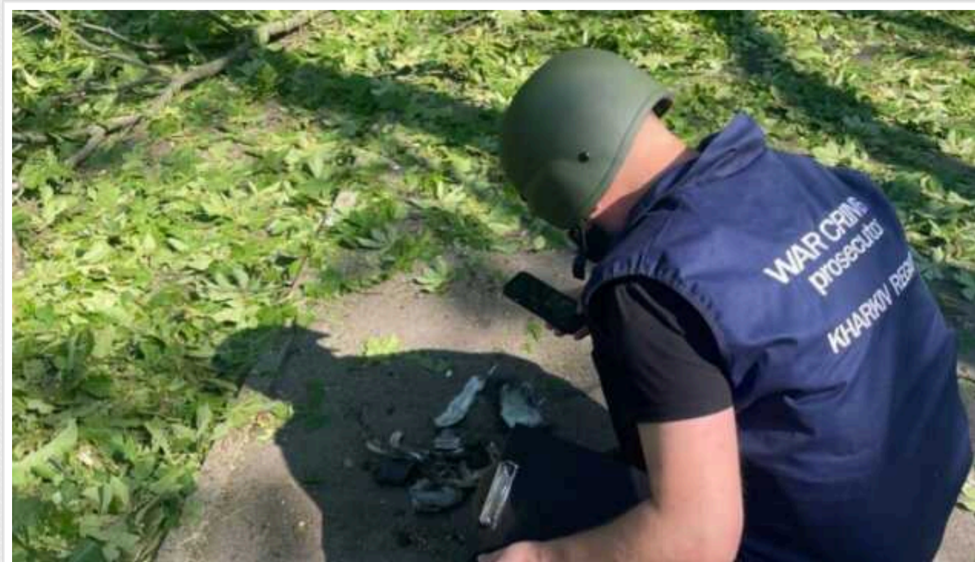
У Харкові під час авіаударів постраждали дві жінки

У Харкові під час авіаударів постраждали дві жінки, в одній із них контузія.