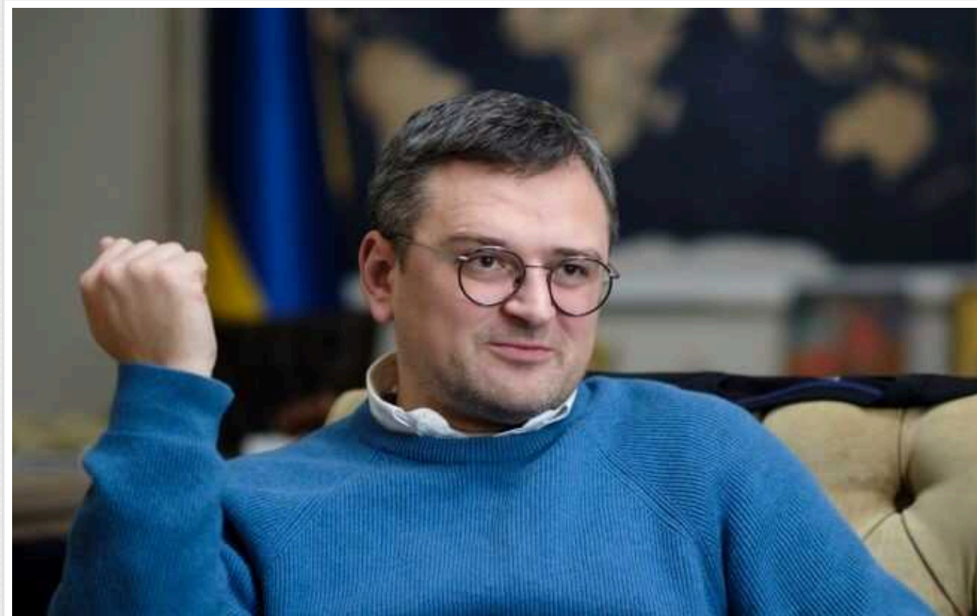
Кулеба вважає, що у невдачах України на фронті винні всі, хто робить недостатньо

Глава МЗС України Дмитро Кулеба заявив: "У невдачах України на фронті винні всі, хто робить недостатньо".