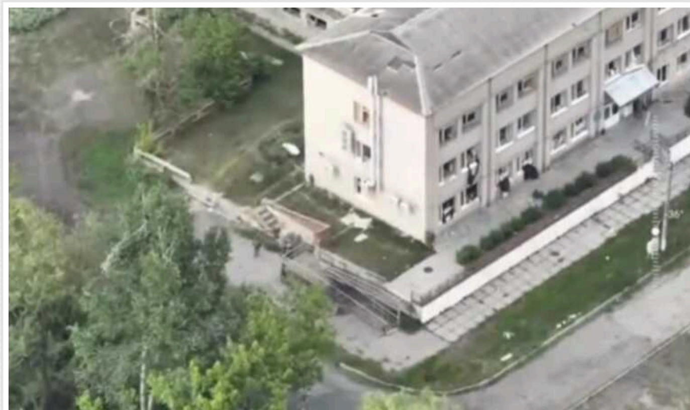
Десятки кадирівців було ліквідовано авіаударом по лікарні Вовчанська, – заступник командира Легіону «Свобода Росії»

Російські терористи захопили будівлю лікарні у Вовчанську Харківської області та накопичували там штурмові підрозділи. Тому українським військам довелося знищити медустанову, щоби завдати ворогові величезних втрат.