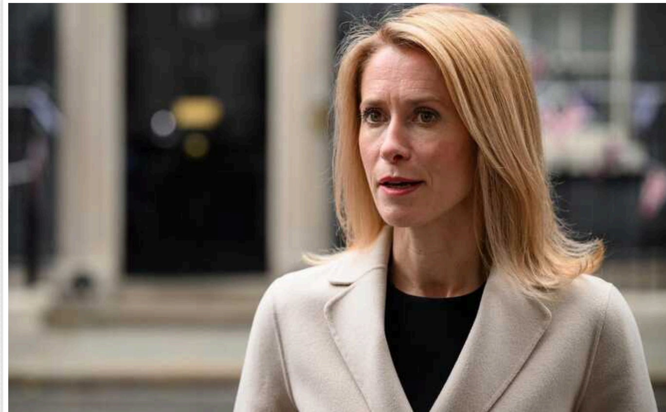
Прем'єрка Естонії Кая Каллас пояснила, чому Україна отримує недостатньо підтримки

Прем'єр-міністерка Естонії Кая Каллас заявила, що Україна не отримує військової допомоги від партнерів у необхідному обсязі. Це пов'язано з тим, що вільний світ у наданні підтримки нашій країні стримує страх.