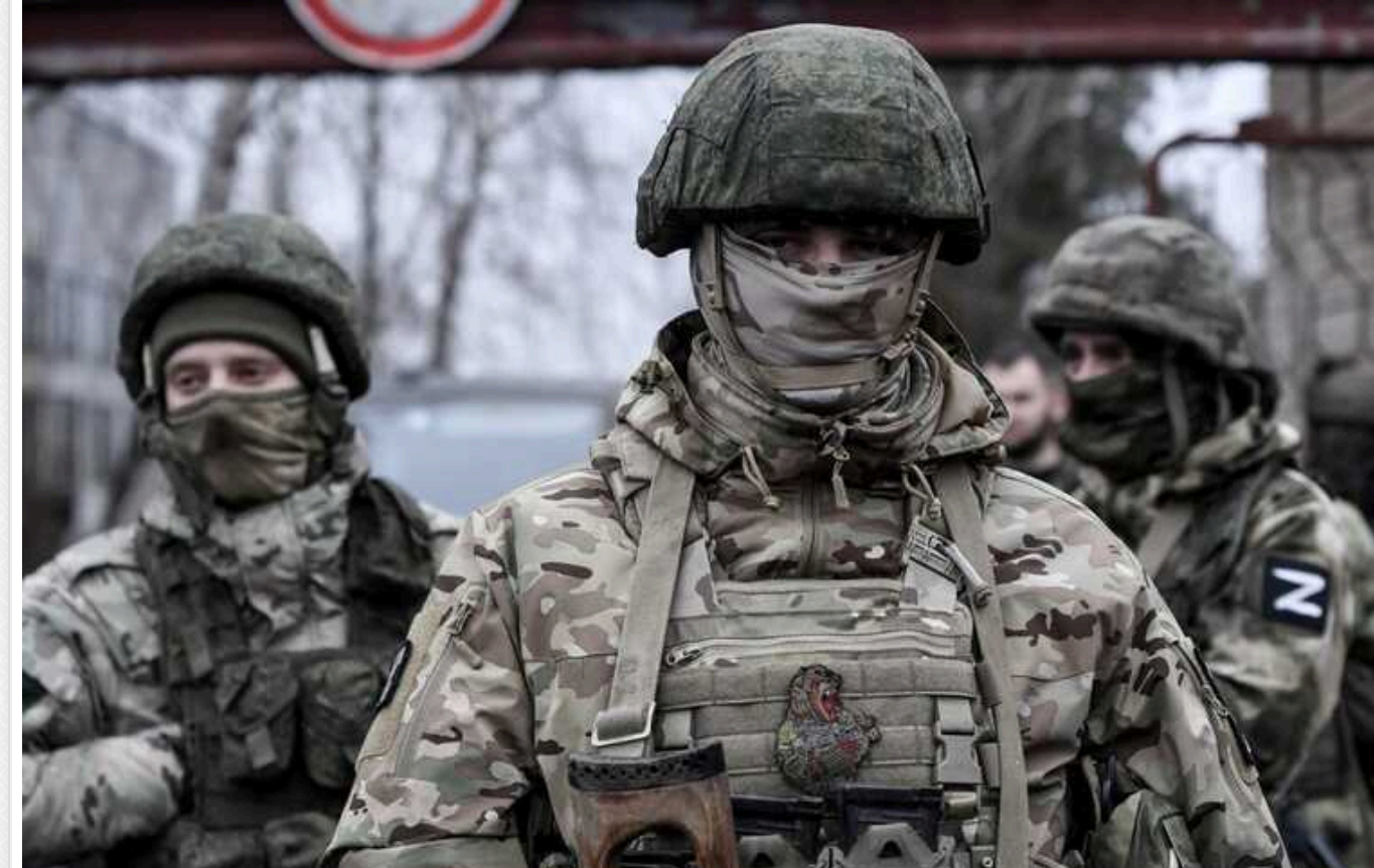
Окупанти готуються до другого етапу наступу на Харківщині: в ISW вказали, на що націлився ворог

Окупаційні війська Росії вже планують другий етап своєї наступальної операції на півночі Харківської області, яку мають намір розпочати після очікуваного захоплення Вовчанська. Ворог віддає пріоритет взяттю міста, оскільки воно є однією з тактичних цілей, що залишилися під час першого етапу його "прориву" на кордоні.