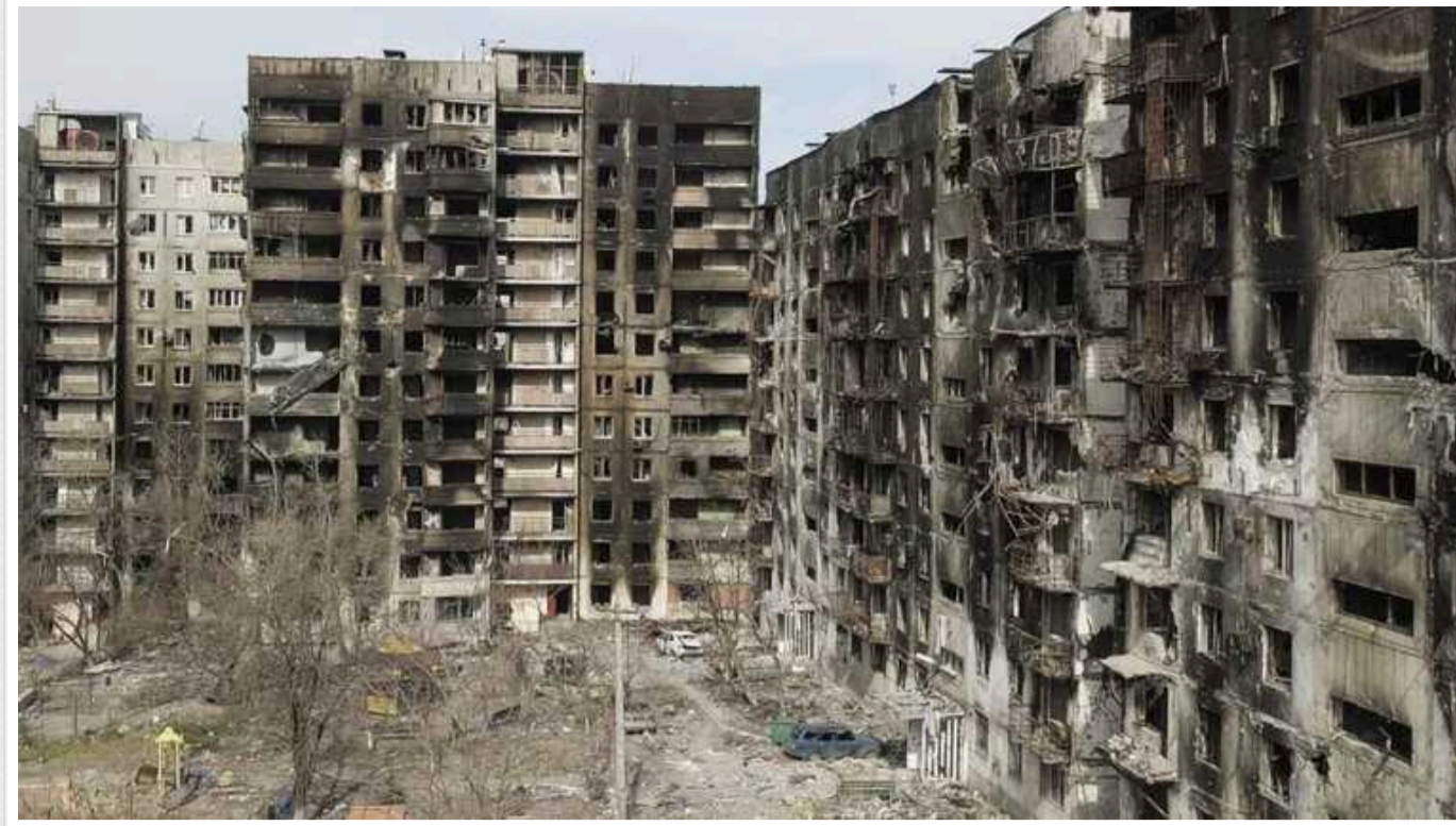
Окупований Маріуполь активно заселяють росіянами та мігрантами з Центральної Азії

Країна-терорист Росія активно заселяє тимчасово окупований Маріуполь громадянами РФ, а також мігрантами із Центральної Азії. Проте більша частина міста досі порожня, тому загарбники активно готують квартири українців до заселення росіян.