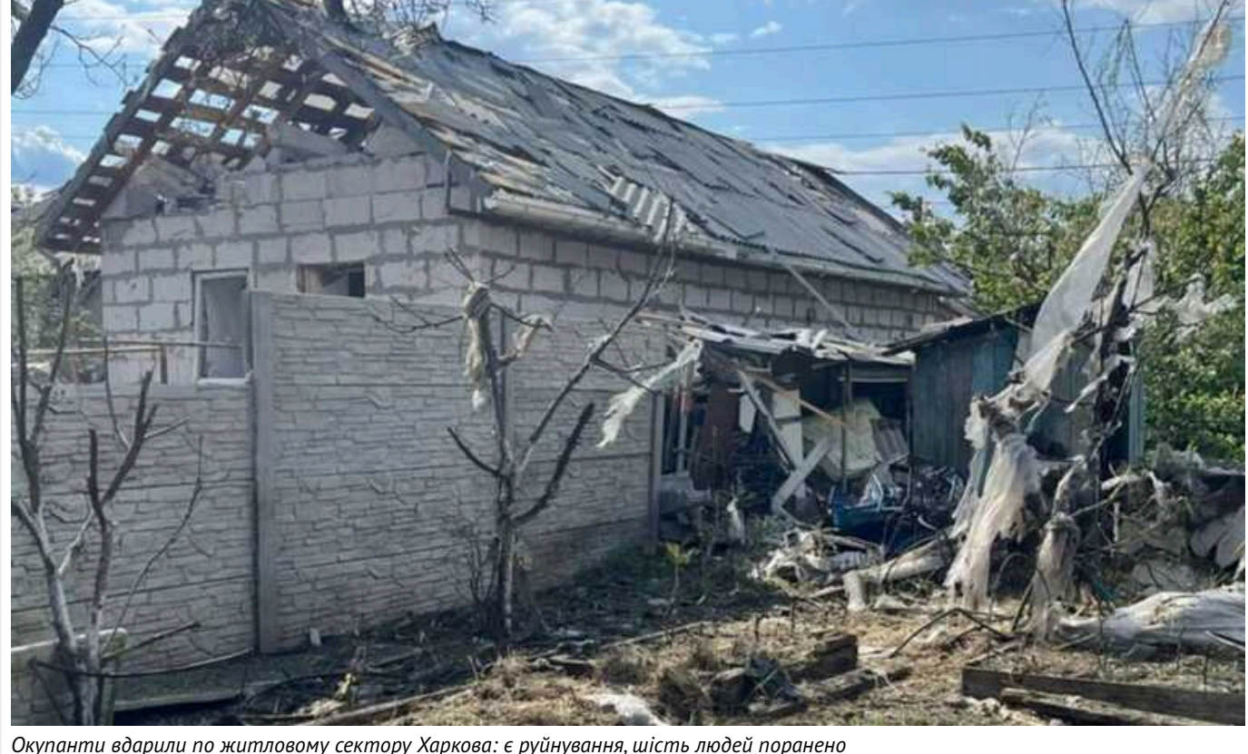
Окупанти вдарили по житловому сектору Харкова: є руйнування, шість людей поранено

Війська Росії ввечері 18 травня вдарили по житловому сектору Харкова. Унаслідок прильоту кілька приватних будинків зруйновано, постраждало шестеро людей.