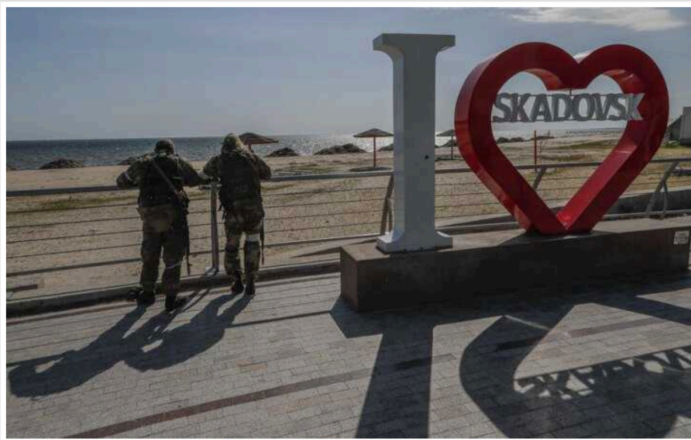
В окупованому Скадовську пролунали вибухи

У Скадовську вранці 18 травня пролунали декілька вибухів, окупанти заявили про ракетний удар.