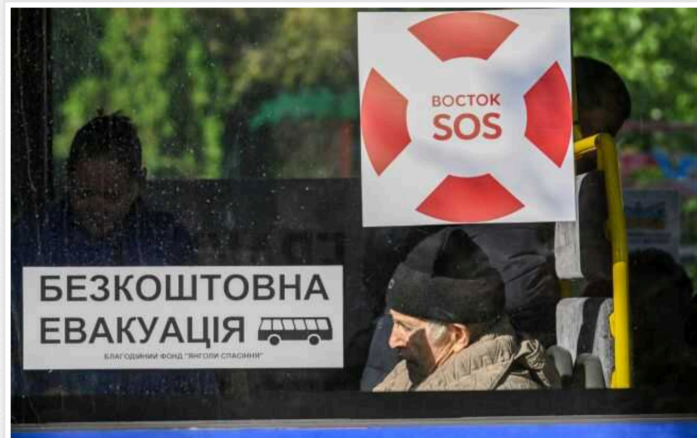
Із прикордоння Харківської області евакуювали вже майже 10 тисяч людей

З прикордонних сіл Харківської області евакуювано вже 9900 людей. Зокрема, лише з Вовчанська вивезено п'яту частину від цієї кількості.