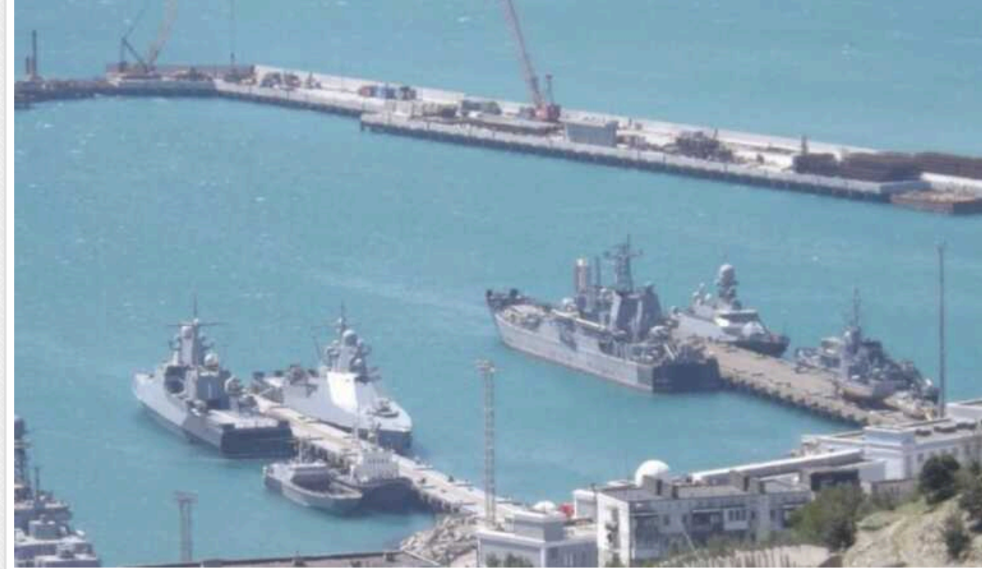
Росіяни зміцнюють військово-морську базу в Новоросійську, – «АТЕШ»

Російські окупанти зміцнюють військово-морську базу в Новоросійську (Краснодарський край, РФ). Роблять вони це, сподіваючись захиститись від українських морських дронів.