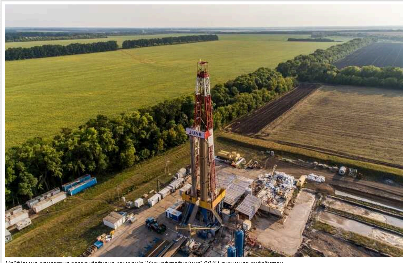
Найбільша приватна газовидобувна компанія "Укрнафтобуріння" (УНБ) зупинила видобуток

Від грудня 2023 року "Укрнафтобуріння" не працює. Через це держава втратила близько 10 мільярдів гривень податків і дивідендів на рік, а також не видобувається 500 мільйонів кубометрів газу, які потрібні для енергонезалежності України.