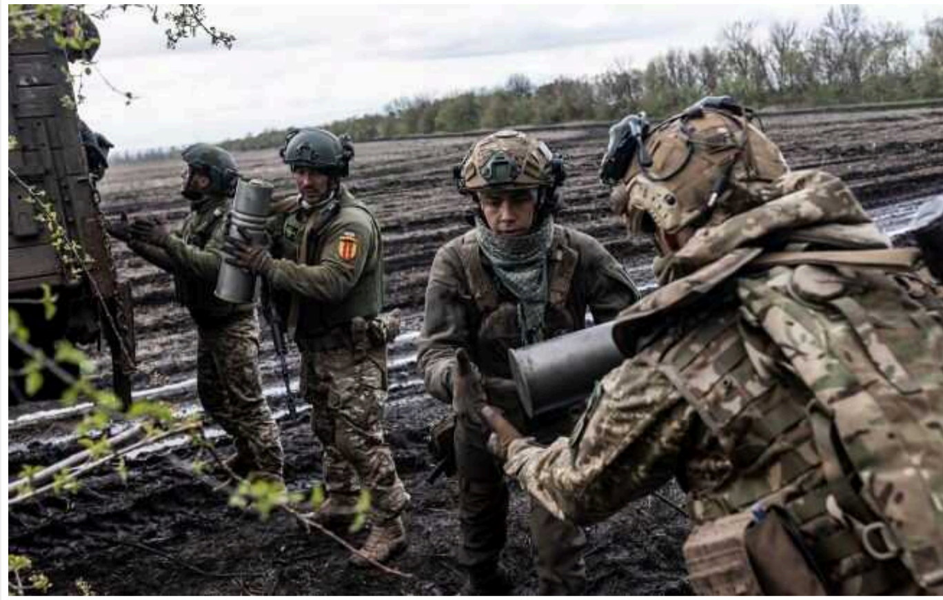
Солдати п'яти українських бригад в інтерв'ю заявили про брак снарядів

Видання Le Monde взяло інтерв'ю у солдатів п'яти українських бригад, дислокованих на Донбасі, де йдуть найзапекліші бої.