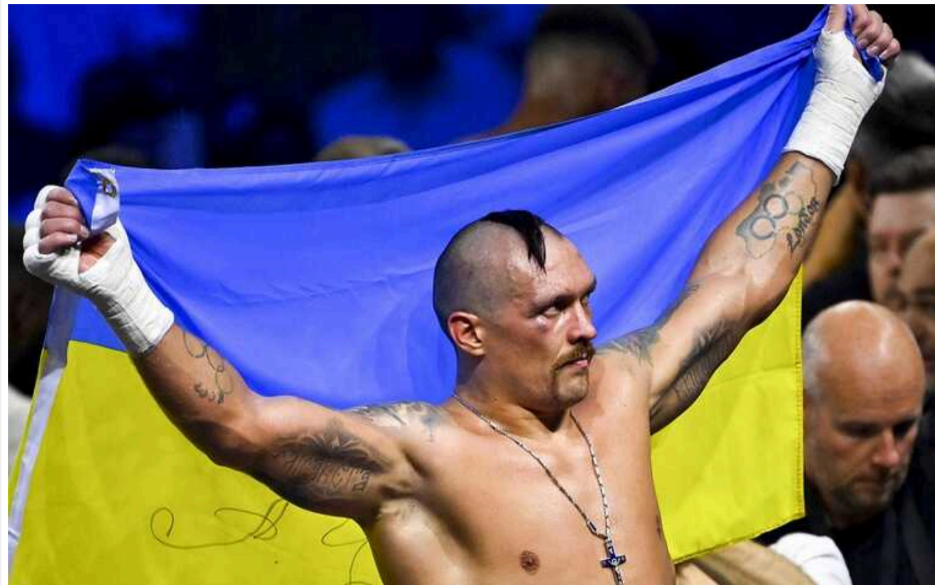
Усик прибув на зважування у вишиванці з портретом загиблого героя, якого жорстоко розстріляли росіяни

Чемпіон світу з боксу в суперважкій вазі за версіями WBA, WBO, IBO та IBF Олександр Усик (21-0, 14 KO) з'явився на офіційній церемонії зважування перед боєм із володарем титулу WBC Тайсоном Ф'юрі (34-0-1, 24 KO) вишиванці із портретом українського військового Олександра Мацієвського, якого жорстоко розстріляли росіяни.