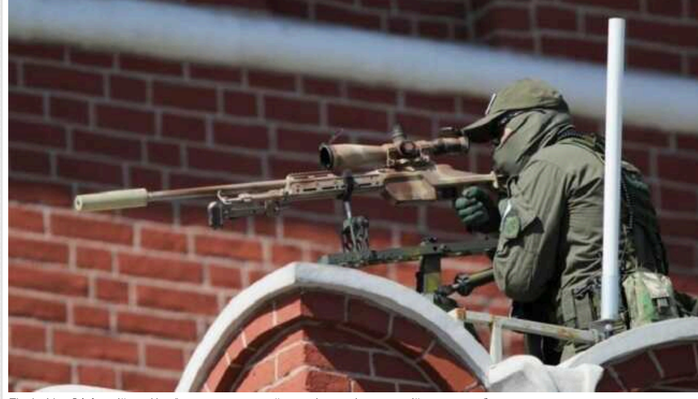
The Insider: РФ для війни з Україною закуповує снайперські гвинтівки австрійського виробництва

Країна-агресорка Росія у війні проти України використовує снайперські гвинтівки та пістолети, зроблені австрійською компанією Steyr Mannlicher. У РФ що зброю завозять в обхід санкцій Європейського Союзу і попри те, що Австрія на офіційному рівні дотримується нейтралітету, чим у Відні пояснюють відмову від постачання зброї Україні.