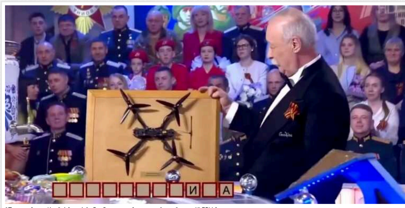
"Поле чудес у Країні дурнів": Якубовичу подарували "український" FPV-дрон

Так званий «музей» російського пропагандистського шоу Поле чудес (так, його ще показують) поповнився «безпілотником-камікадзе».