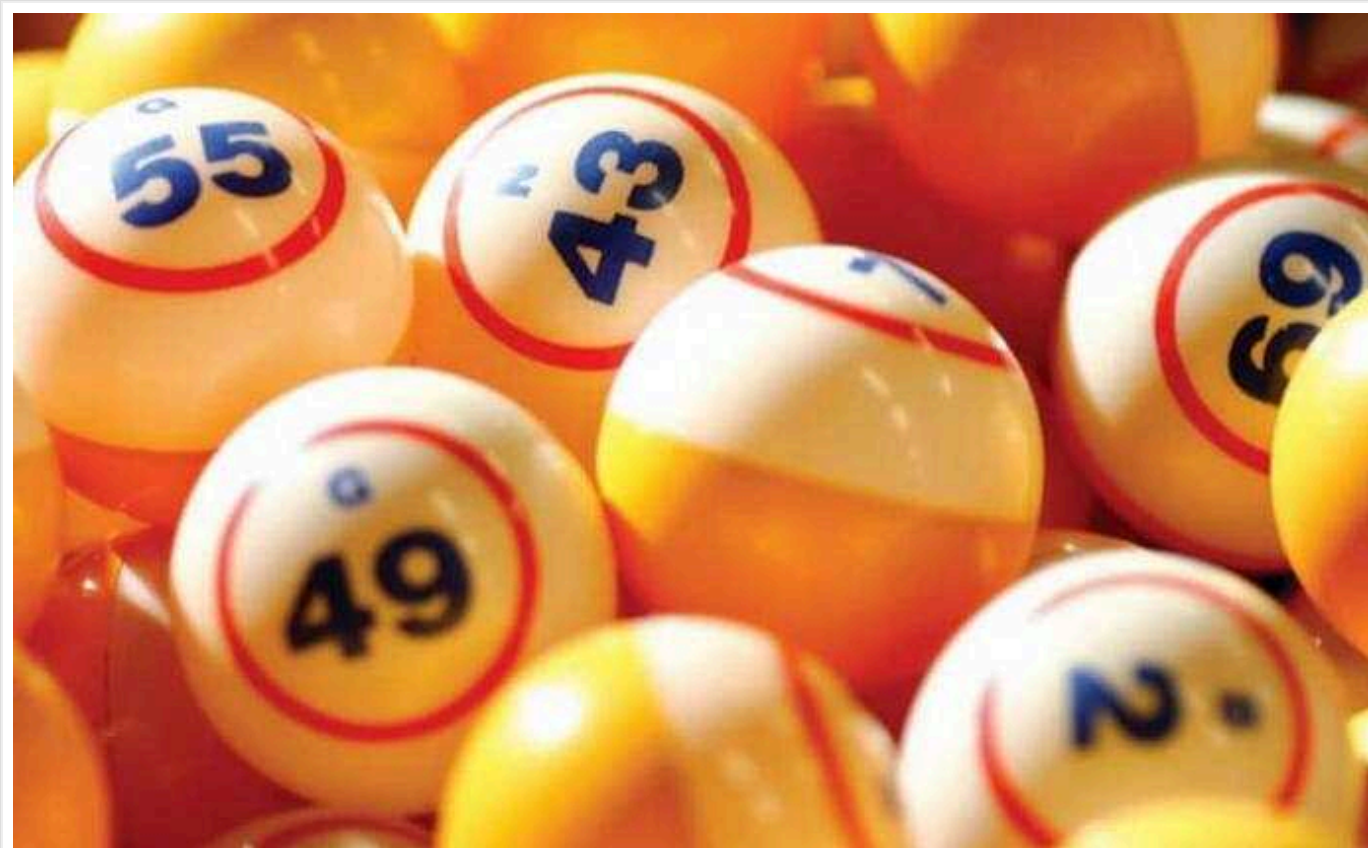
Родом із Росії чи Великої Британії: що відомо про українського оператора лотереї «Патріот»

Хто зараз є власником лотереї "Патріот".