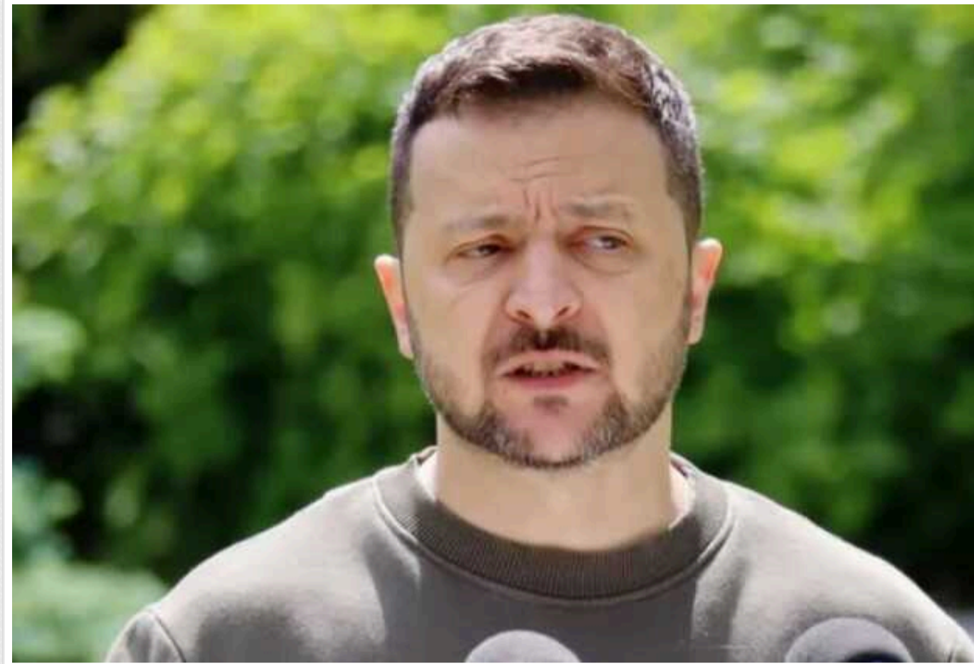
Зеленський вказав на ризики в разі перемир'я під час ОІ-2024 і пояснив, чому Путіну не вигідний діалог

Президент України Володимир Зеленський скептично висловився щодо ідеї вести перемир'я на фронті на час Олімпіади. За словами глави держави, це не ефективно з російським ворогом, крім того, окупанти можуть використати режим тиші, щоб на танках ближче під'їхати до позицій Сил оборони, а потім розпочати наступ.