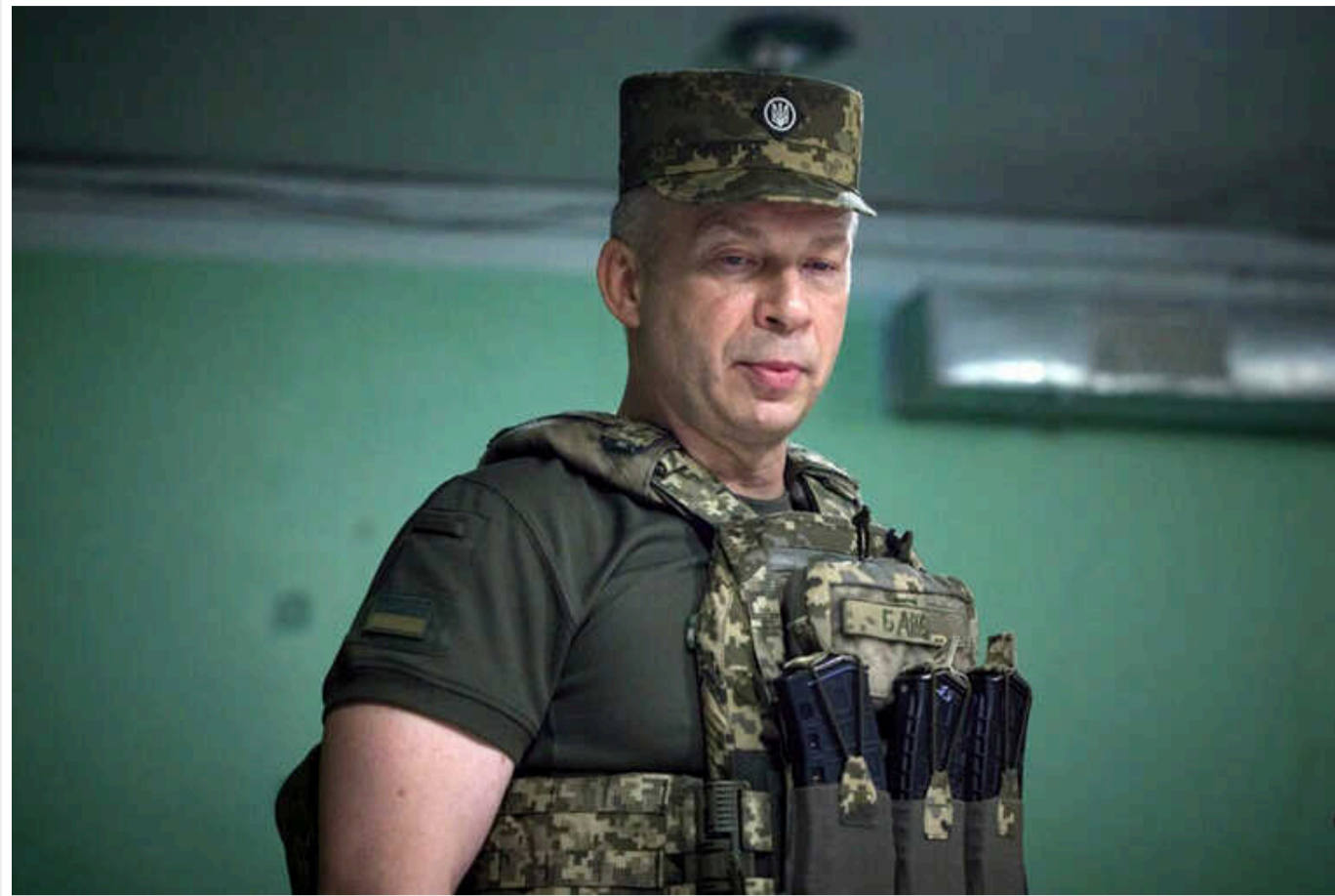
РФ розширила зону активних бойових дій на 70 кілометрів, - Сирський

Росія розширила зону бойових дій на 70 кілометрів, щоб примусити Україну задіяти бригади з резерву. У Харківській області тривають важкі бої.