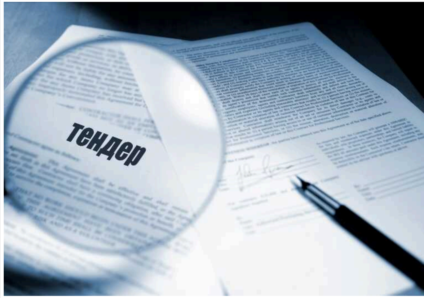
Компанія з Ірпеня отримала 226 мільйонів на добудову ЖК «Forest» на Лісовому масиві

КП «Спецжитлофонд» Київської міської ради 29 квітня за результатами тендеру замовило ТОВ «Смарт Універсал Груп» завершення будівництва житла у Деснянському районі Києва за 225,55 млн грн. Ціни переважно ринкові.