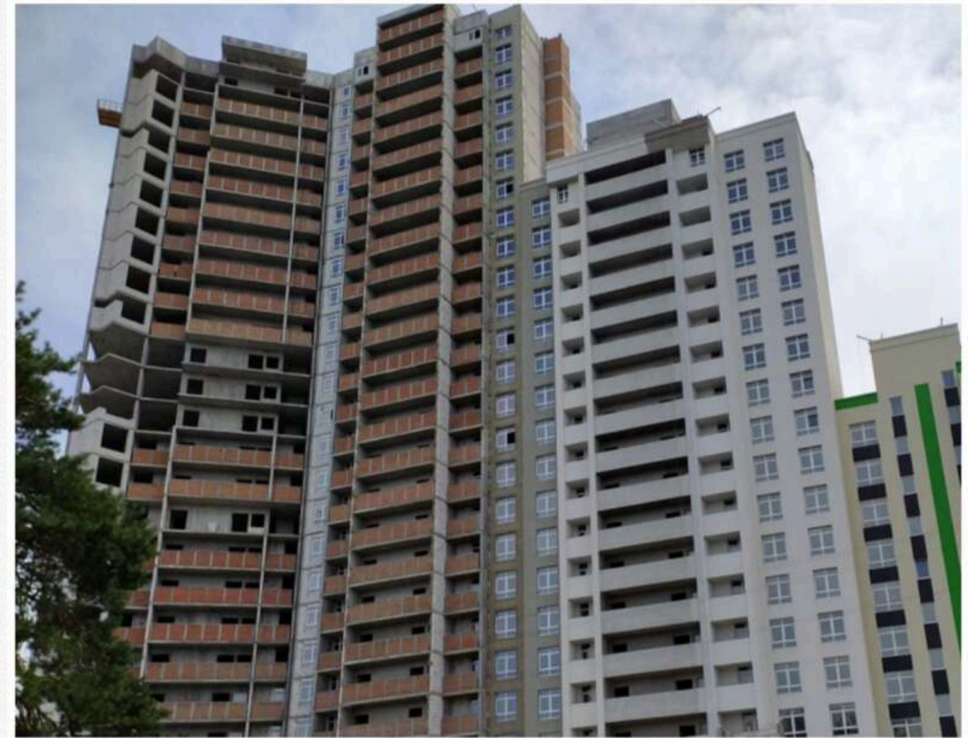
Будівельний майданчик ЖК "Forest" станом на серпень 2023 року

Про це повідомляється у системі «Прозорро» .