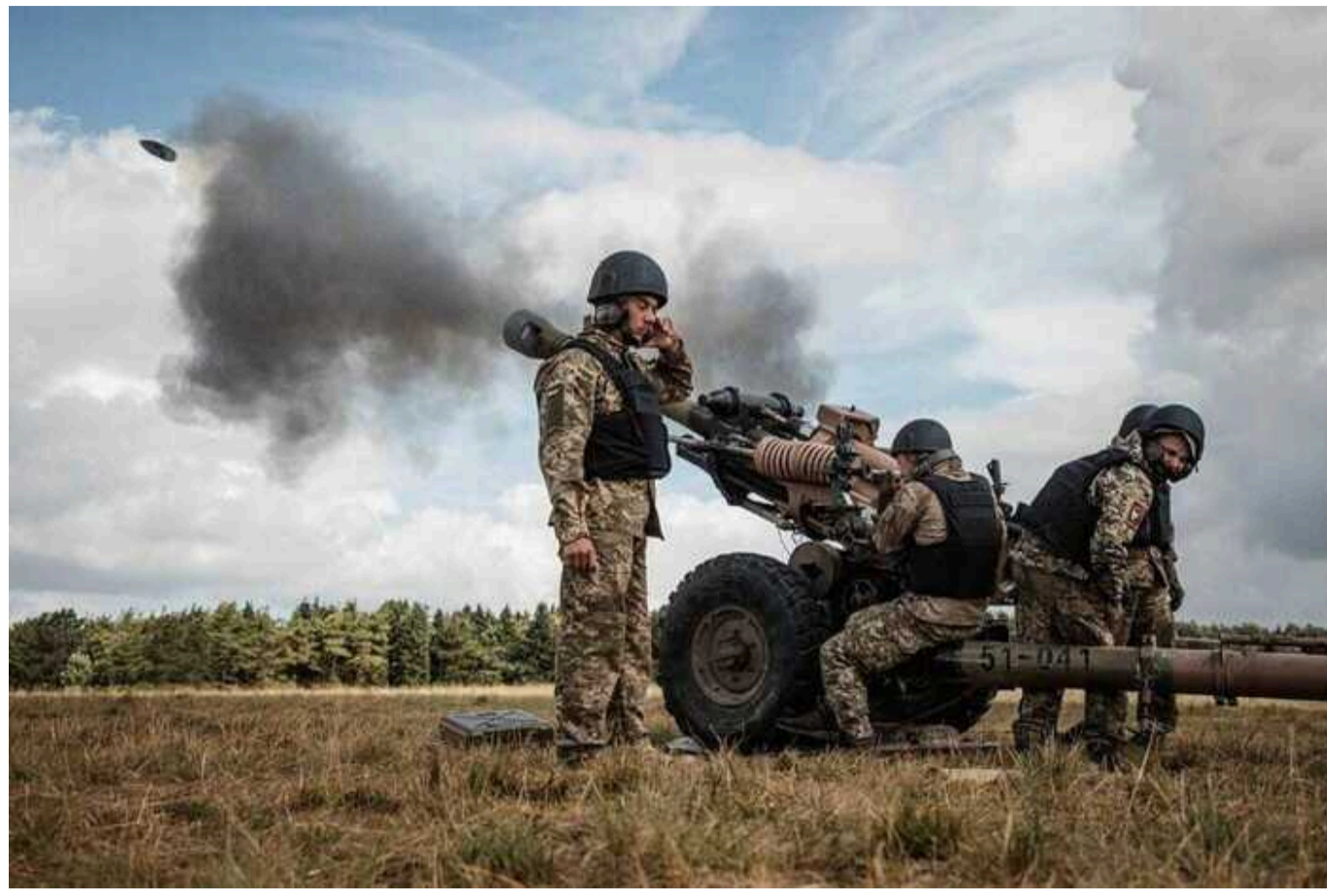
Через заборону Заходу на обстріли російської території Україна не змогла побудувати смугу оборони біля кордону, - ISW

ISW пише, що Україна не побудувала смугу оборони біля кордону з РФ через заборону Заходу на обстріли російської території.