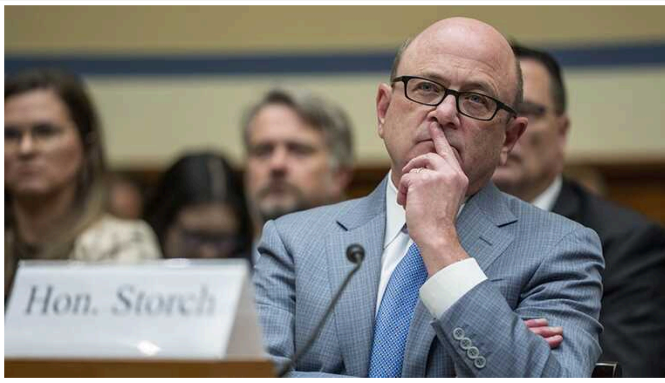
У США назвали корупцію в Україні однією з найвищих у світі

У доповіді до Конгресу США генінспектора Пентагону Роберта Сторча повідомляється, що корупція в Україні залишається однією з найвищих у Європі.