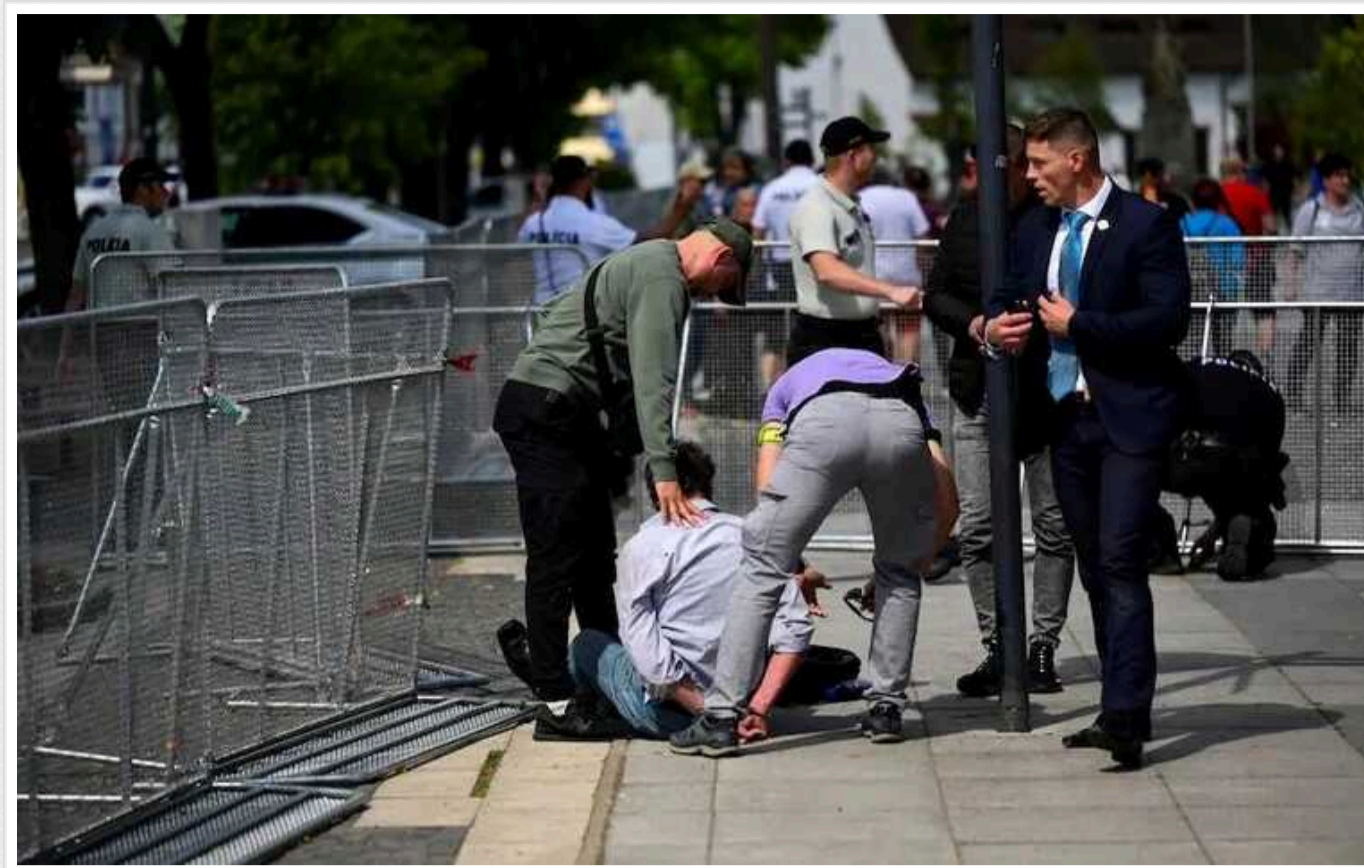
Словацькому стрільцю оголосили підозру, - ЗМІ

Словацькому стрільцю оголосили підозру у замаху на прем'єра Роберта Фіцо.