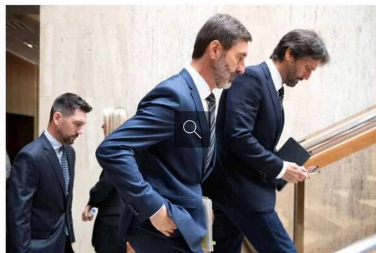
Defence Minister Robert Kaliňák (r) and Foreign Minister Juraj Blahár (foreground) arrive at the Security Council meeting in Bratislava on May 16, 2024.

Теги: Чинтула Юрай Покушення Підозра підозренине Словакия Словаччина Фіцо Роберт