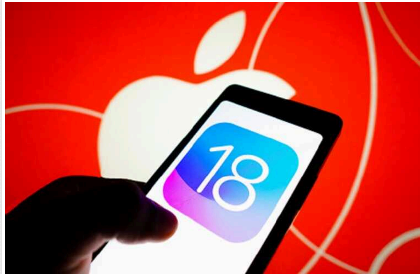
Apple анонсувала незвичайну функцію для користувачів Eye Tracking

Компанія Apple анонсувала технологію Eye Tracking, яка повинна дозволити користувачам керувати iPhone та iPad за допомогою очей.