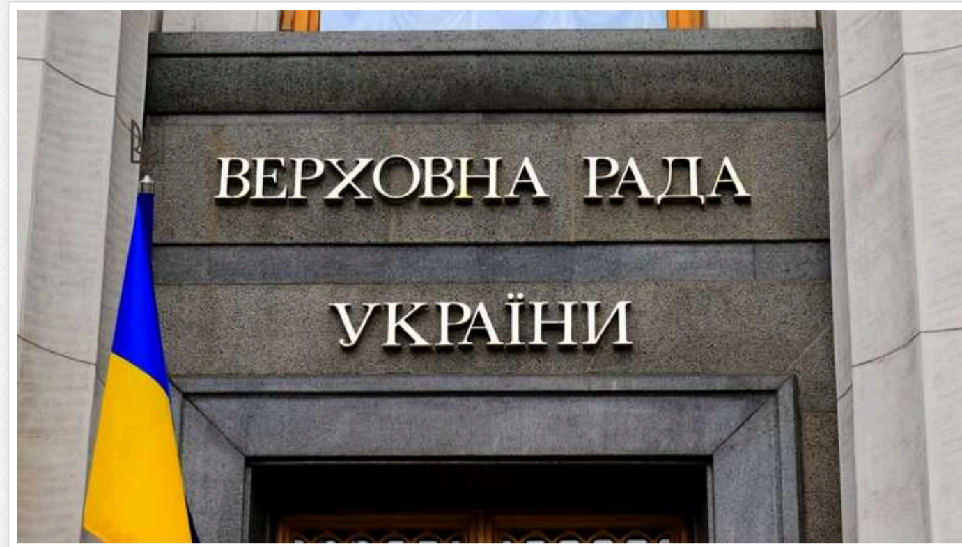
В Україні закликали ВРУ не ухвалювати законопроект, який може обмежити доступ до судового реєстру

Українські правозахисники, юридичні й антикорупційні організації у зверненні закликали Верховну Раду не ухвалювати законопроект, який може обмежити доступ до судового реєстру. Зокрема, закрити рішення щодо позовів людей до ТЦК.