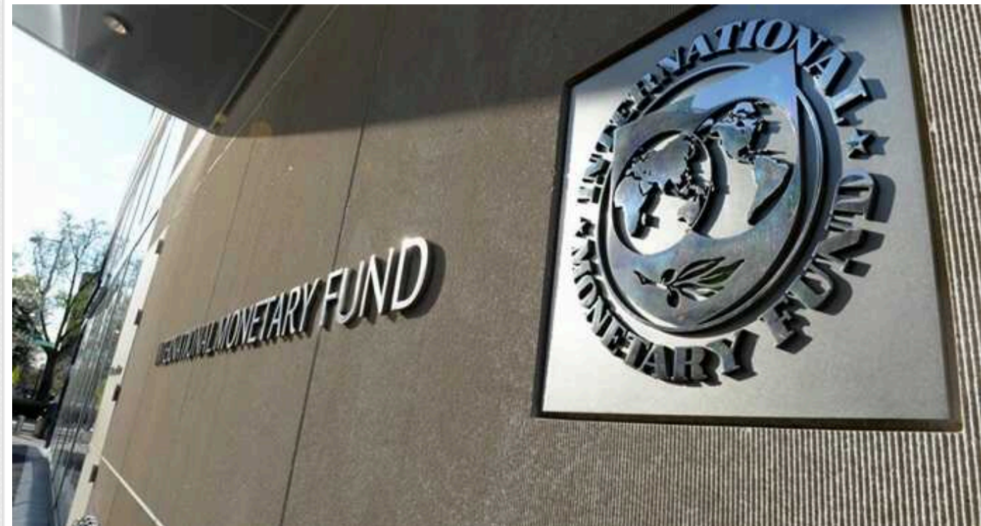
Плани Заходу використати активи РФ можуть підірвати світову валютну систему, - МВФ

МВФ вважає, що плани Заходу використати активи РФ можуть підірвати світову валютну систему.