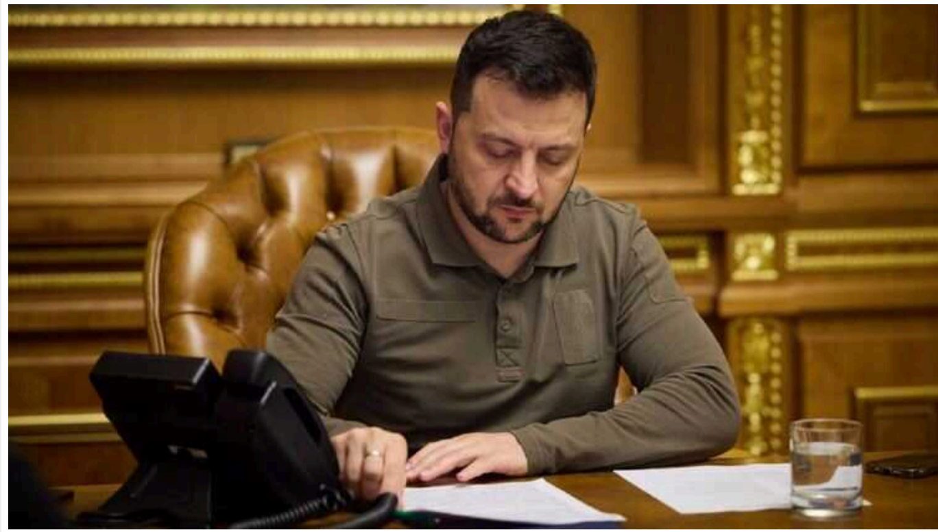
Зеленський наклав вето на законопроект про звільнення за приховування родичів у Росії

Президент України Володимир Зеленський ветоував законопроект про звільнення з роботи за колабораційну діяльність та за приховування родичів у Росії. Йдеться про ухваленій 25 квітня 2024 року парламентом документ №7731.