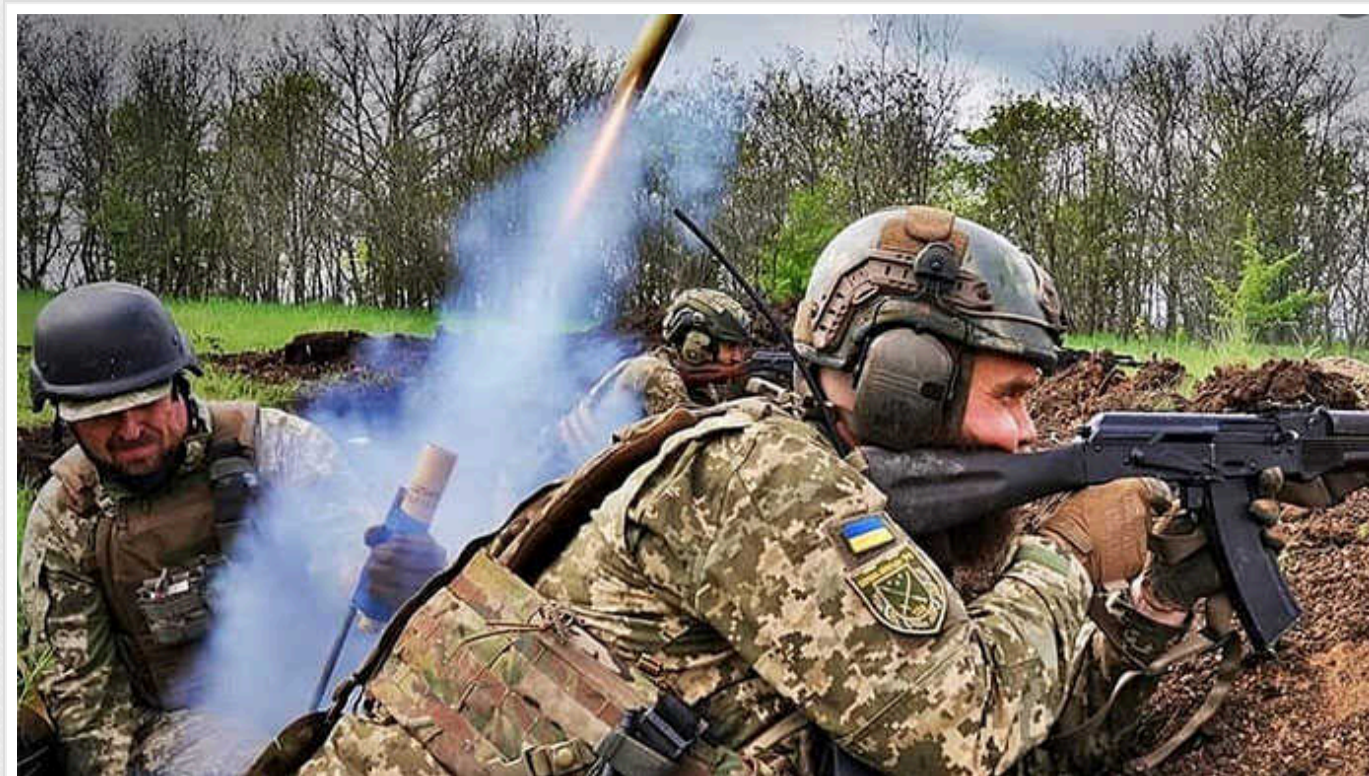
ЗСУ контратакували у районі Вовчанська, – Генштаб