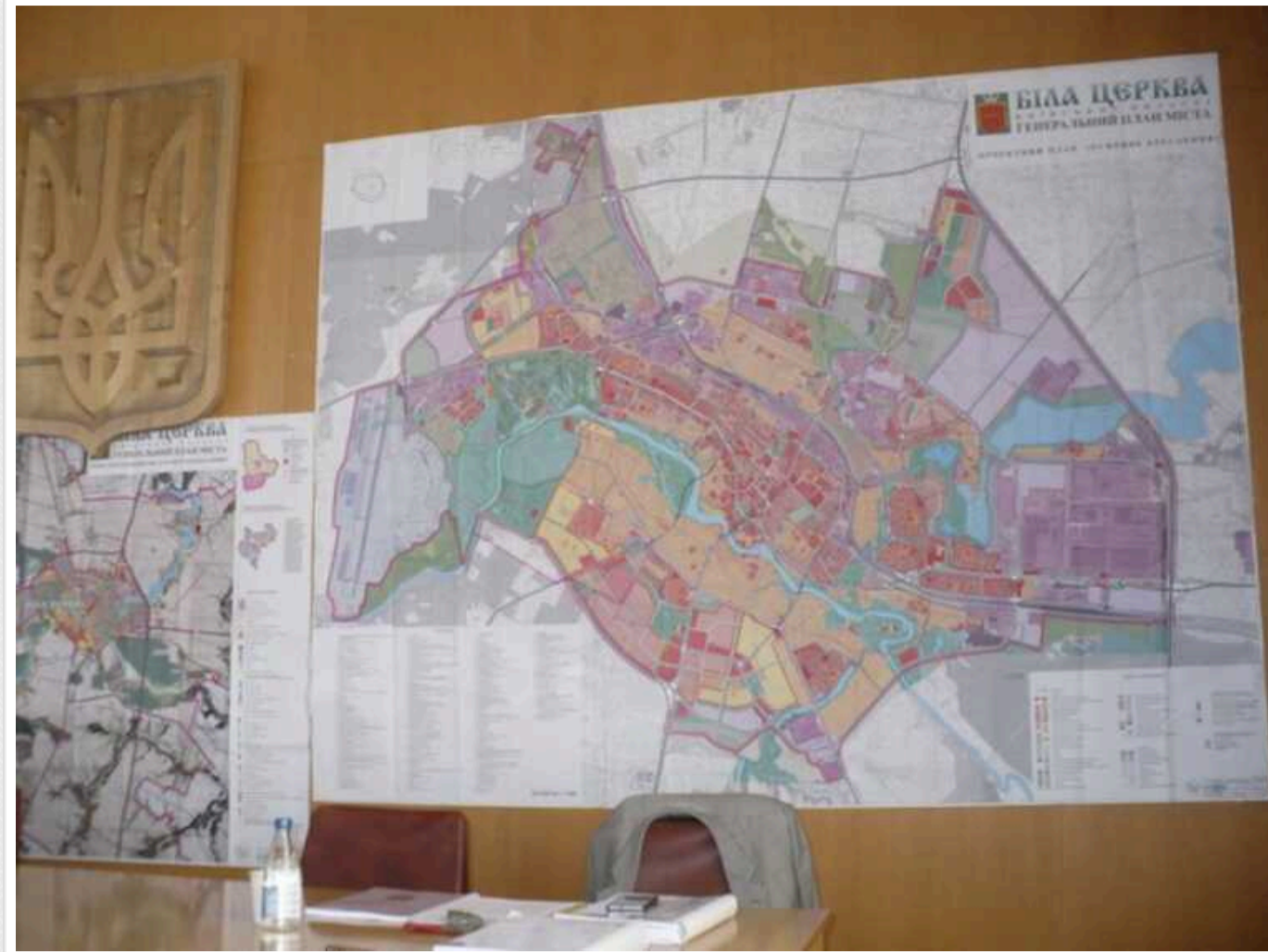
У Білій Церкві планують вкласти 6 мільйонів гривень в оновлення Генплану

Управління містобудування та архітектури Білоцерківської міської ради оголосило тендер. Шукають підрядника для роботи із містобудівною документацією.