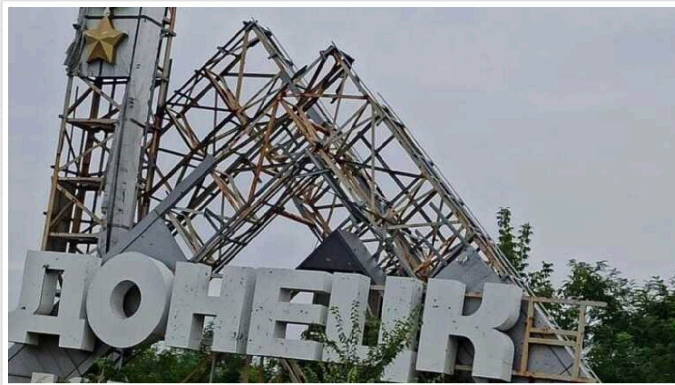
Мародерство по-крупному або бізнес по «ДНРівськи»

У «ДНР», а це нібито вже РФ, вирішили відібрати вантажі, що знаходяться в порту Маріуполя, і реалізувати їх самим собі.