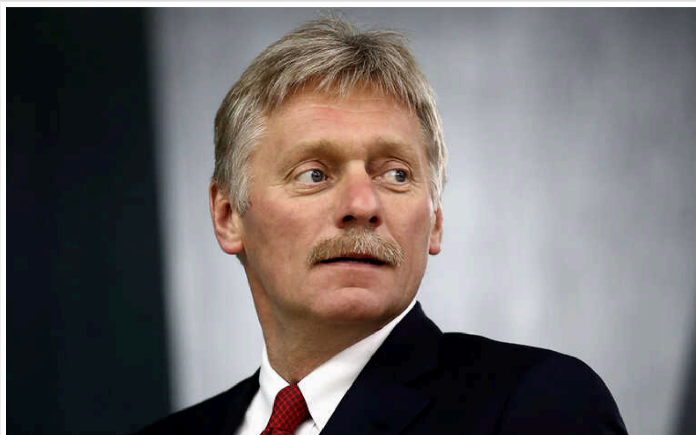
У Кремлі висловилися про замах на словацького прем'єра Фіцо

Путінський пресекретар Дмитро Песков заявив, що країна-терорист Росія засуджує напад на прем'єр-міністра Словаччини Роберта Фіцо. За його словами, у РФ вважають цей напад "абсолютно неприйнятним".