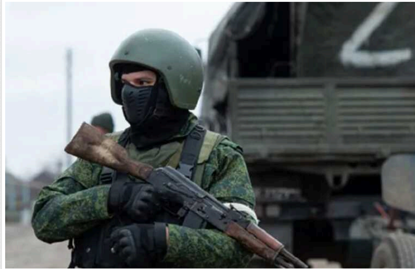
Росіяни розстріляли мешканця Вовчанська, який відмовився виконувати їхні накази, – МВС

Російські окупаційні війська захопили у Вовчанську на Харківщині у заручники цивільних громадян. Вони не дозволяли місцевим мешканцям евакуюватися: людей почали викрадати та зганяти до підвалів.