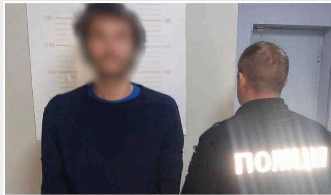
У Києві конфлікт між бабусяю та онуком завершився вбивством

Правоохоронці затримали мешканця Києва, який, за інформацією слідства, вбив рідну бабуся. Під час сімейної сварки онук кухонним ножом завдав одинадцять ударів своїй родичці.