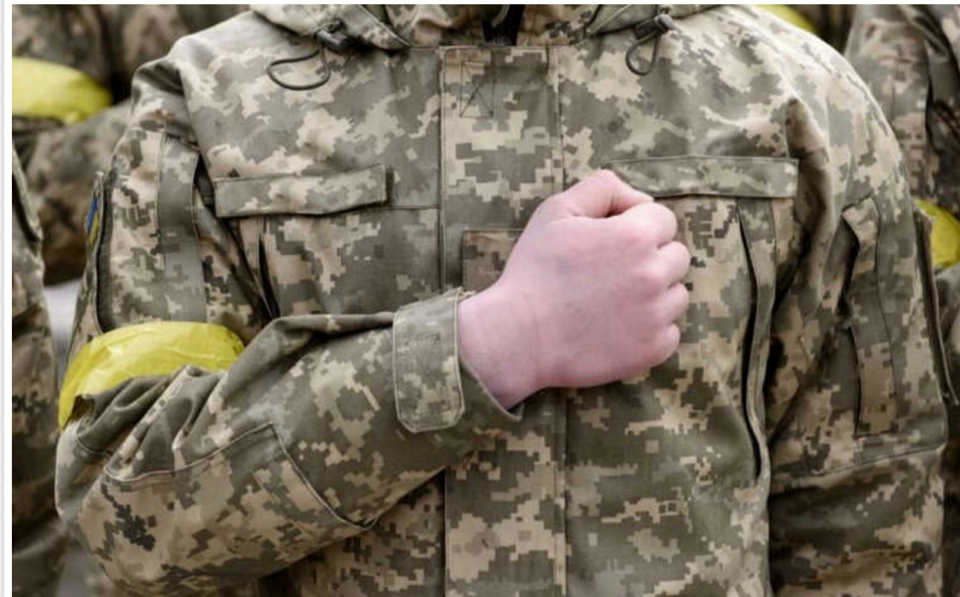
У ЗСУ прогнозують мобілізацію додатково 100 тисяч молодих бійців 25-26 років

Все за рахунок зниження планки призову з 27 до 25 років.