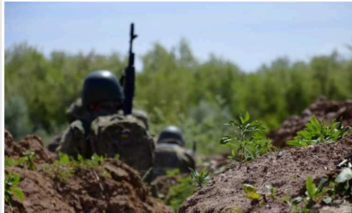
Плани ворога максимально вклинитися в глибину міської забудови Вовчанська і закріпитися там – зірвані, – Генштаб

Сили оборони примусили ворога значно знизити свою активність у Вовчанську і відтіснили противника на Куп'янському напрямку.