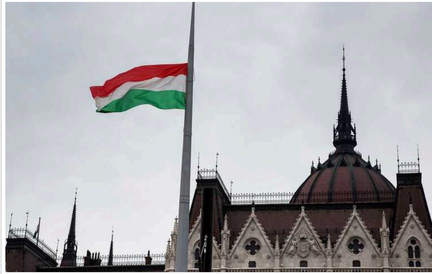
В уряді Угорщини брехали, називаючи велику кібератаку РФ на МЗС вигадкою, – ЗМІ

Угорські ЗМІ отримали доступ до внутрішніх документів, які доводять, що угорська влада знала про кібератаку понад 2-річної давнини на МЗС, за якою, ймовірно, стояли російські хакери, хоча тоді заперечувала її.